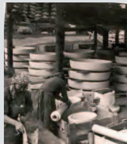
1930 Beginn der Fertigung mechanischer Kläranlagen