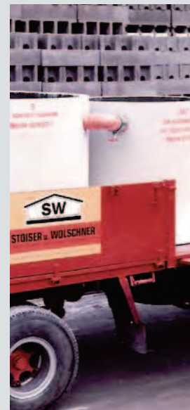
1981 Mineralölabscheider werden in die Produktion aufgenommen